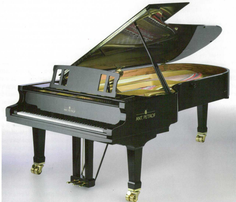
Klavír ANT. PETROF 275

podnikání v Číně. Vše gradovalo kolem českého státního svátku. Co si o tom všem myslíte? Jsme malá země, deset miliónů obyvatel je velikost jednoho menšího čín-