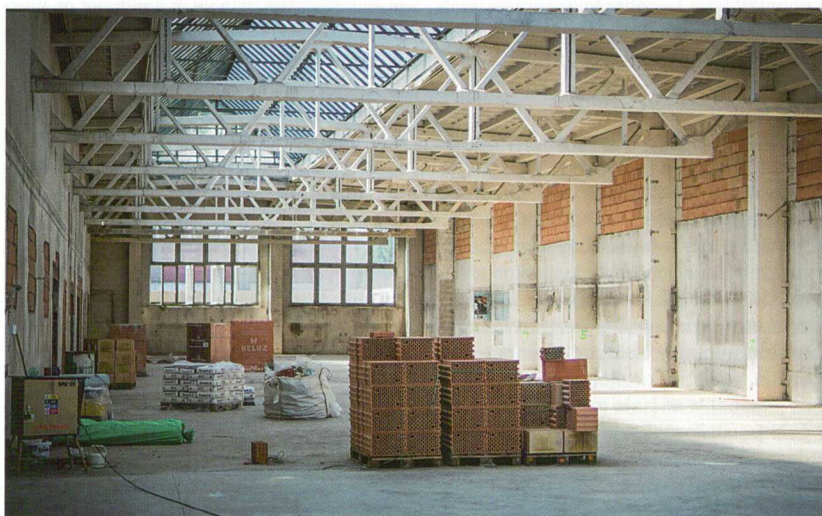
Výstavba nového kulturního centra PETROF Gallery v areálu továrny v Hradci Králové

Je příjemné slyšet, že slavná česká rodinná firma připravuje další generaci. ☺ ■